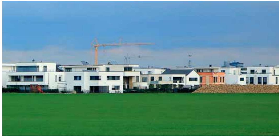
Ausweitung der Speckgürtelzone (hier im Kölner Westen). Mit der Sonder-AfA wär's schneller gegangen.

Ein Kommentar zur gescheiterten Sonder-AfA von Stefan Rettich