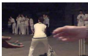
Mitternächtliches Cricket-Spiel im Londoner Finanzdistrikt