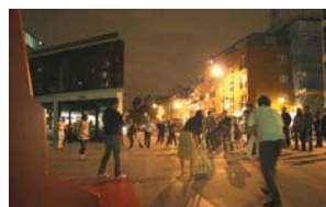
Mitternächtliches Cricket-Spiel im Londoner Finanzdistrikt