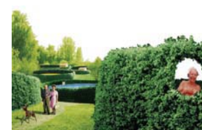
EUROPAN 7, Senftenberg – "Rüstige Rentner"