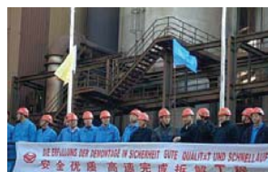
Demontage der Dortmunder Westfalenhütte Dismantlement of the Dortmund Westfalenhütte

Ganz ohne Kunst und Ai Weiwei haben 1001 Chinesen bereits vor sieben Jahren ein beeindruckendes Schauspiel globaler gesellschaftlicher Veränderungen aufgeführt. Bestückt mit Schweißbrenner und anderem schweren Gerät haben sie vor den Augen einer irritierten deutschen Öffentlichkeit das europäische Industriezeitalter am Beispiel der Dortmunder Westfalenhütte in kleine Stücke zerlegt, um diese danach auf 30 Container-Schiffen in ihre Heimat zu verfrachten.