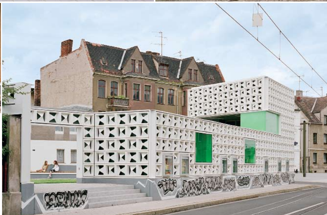
2 Der turmförmige Kubus dient als Freiluftbühne und begrenzt das Lesezeichen zur Kreuzung hin. 3 Mit einem Mock-up aus leeren Bierkästen simulierten KARO* Architekten für die Salker Bürger vor Baubeginn das geplante Gebäude. 4, 5 Markant hebt sich das Lesezeichen vom lange vernachlässigten städtischen Umfeld ab. 6 Die Graffitis durften Jugendliche aus dem Viertel aufsprühen.