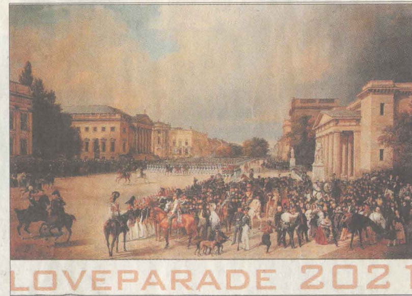
Ikea-Karte von AC Hottich (o) und Loveparade 2021 von Christian Weber.