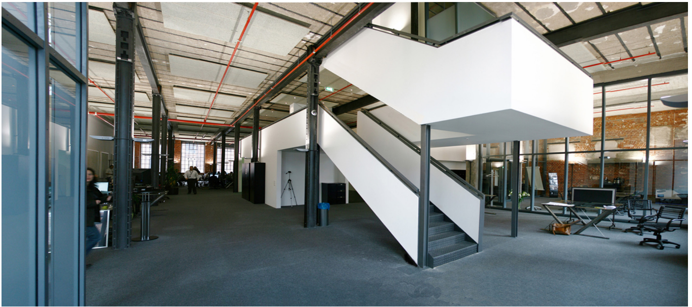
oben links: skulpturale Treppenanlage und Galerieebene mitte: Grundriss EG unten links: offenes Treppenhaus unten rechts: Funktionsbereiche des Callcenters mit Galeriebrücke